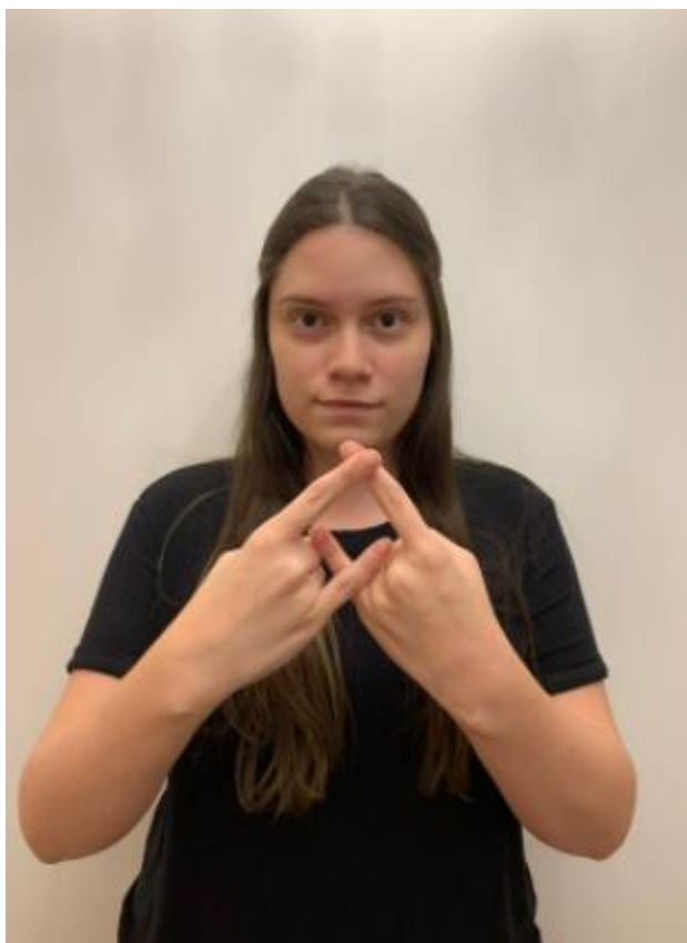
Preservativo / camisinha