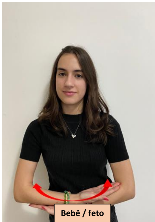
Bebê / feto