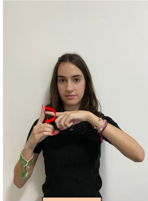
Grávida / gestante