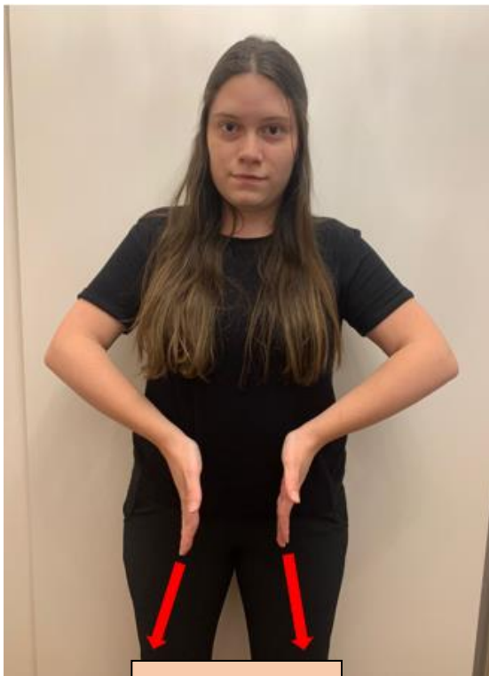
Parto / nascimento