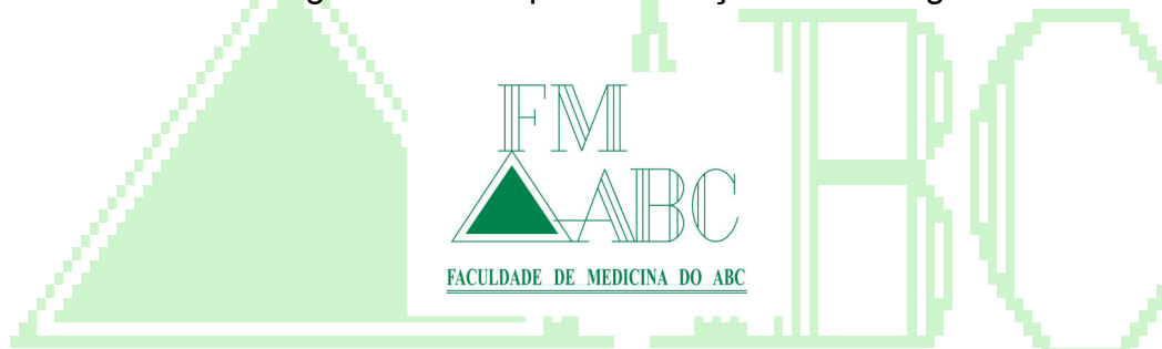
Figura 1 - Exemplo de inserção de uma figura